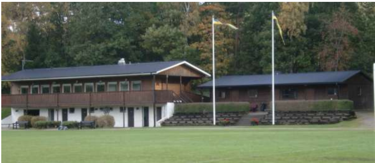
Fotbollsplanen på Björkevi.

På Björket, nedanför Björkevi, finns en utomhusscen där det varje år anordnas tillställningar vid t ex Valborg och midsommar.