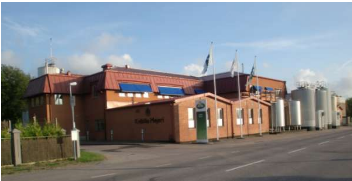
Arla Kvibille mejeri.

Adress: Björkstigen 6 Verksamhet: Taxirörelse, färdtjänst och sjukresor Telefon: 070-247 35 60 E-post: hov.osterblad@telia.com