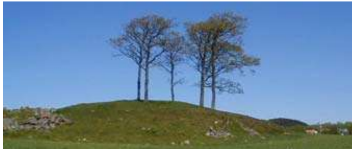
Gravhög på åker utanför Kvibille.

Även på en höjdplatå nordost om Biskopstorp återfinns ett stort antal högar och rösen. Sommaren 1967 gjordes en inventering av fornlämningar i Kvibille varvid registrerades 65 fasta sådana.